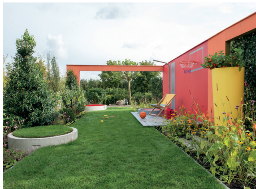
Particuliere tuinbezitters willen graag een fraaie, goed onderhouden tuin.

Van verkoopmedewerkers in tuincentra wordt verwacht dat zij consumenten stimuleren een voorkeursvolgorde te hanteren, die aansluit bij de principes van IPM. Bijvoorbeeld bij onkruid. De eerste keuze daarbij is preventie, door de tuin zo in te richten dat er minder onkruid groeit. De tweede keuze zijn mechanische en thermische technieken om onkruid te bestrijden. De laatste stap is de toepassing van gewasbeschermingsmiddelen. Deze worden zorgvuldig en verantwoord, overeenkomstig het etiket gebruikt. En er wordt geen gebruik gemaakt van illegale middelen.