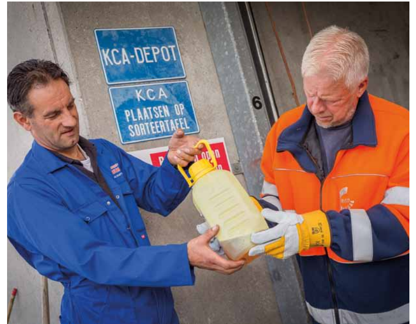
Gemeenten ontvangen van de gewasbeschermingsbedrijven een vergoeding voor het innemen van lege verpakkingen en restanten van gewasbeschermingsmiddelen.

De verstrekte vergoedingen worden gefinancierd door de bedrijven die gewasbeschermingsmiddelen op de Nederlandse markt brengen. Dat zijn voornamelijk de bij Nefyto aangesloten bedrijven, maar ook een aantal andere toelatinghouders.