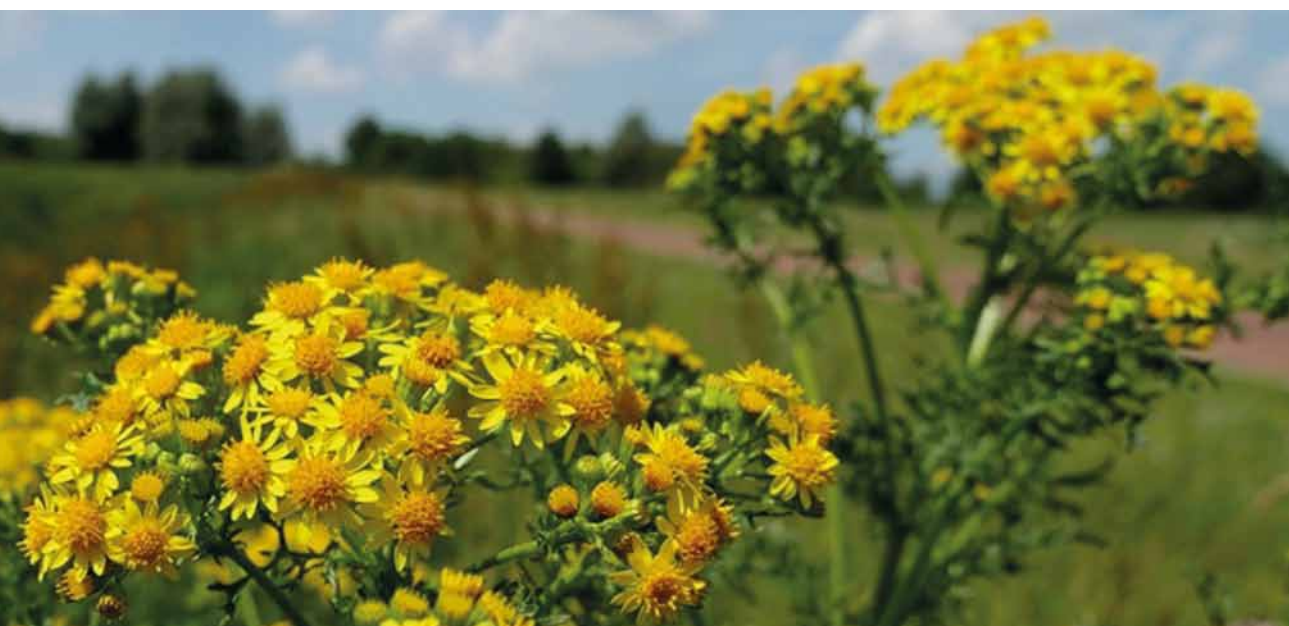
Sommige bermplanten bezorgen boeren problemen, zoals het voor vee giftige jacobskruiskruid.