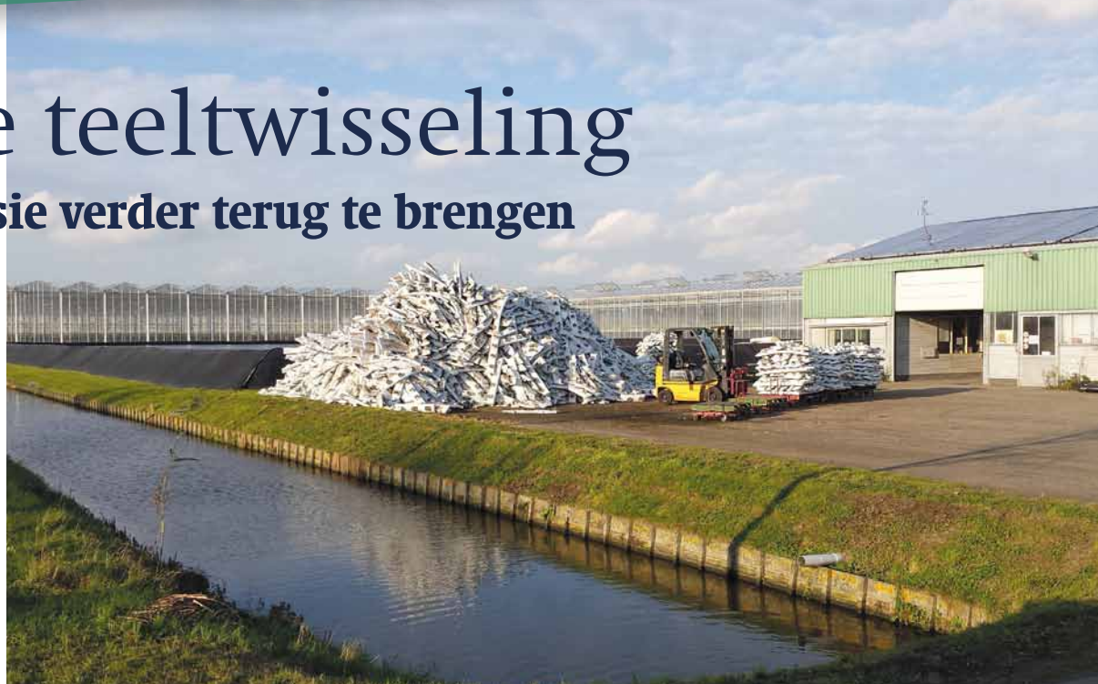
De beëindiging van een teelt is doorgaans meteen een 'grote schoonmaak'. Op de foto gebruikte teeltmatten.