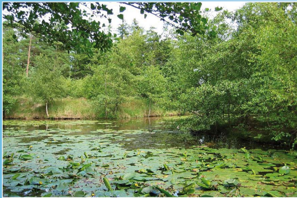
Vergeleken met twintig jaar geleden is de vooruitgang op milieugebied enorm.