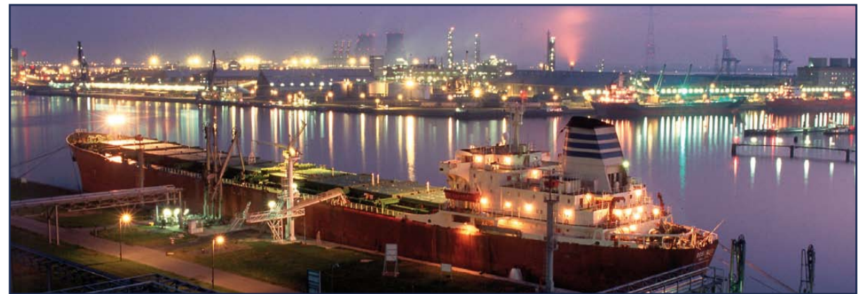
Nederland is een belangrijk doorvoerland en daarmee wellicht ook voor counterfeit gewasbeschermingsmiddelen.

Het spreekt vanzelf dat de industrie vanuit economisch oogpunt niet blij is met het groeiende volu-