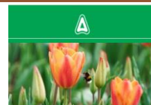
Nieuwe methoden bolverwerking zijn nodig

Ook worden er artikelen over suikerbietenteelt en blogs over aardappelteelt gemaakt. Hierdoor behoudt de teler een goed kennisniveau over gewasbeschermingsmiddelen en de teelt.